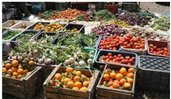
Marché au Maroc