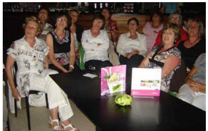
Giens 2012 : Les Maarifiennes !!!