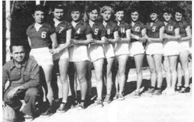
Equipe de Basket féminine de 1953.