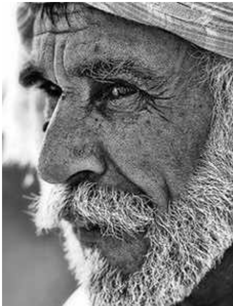
Photo : http://visages-et-portraits.over-blog.fr/article-33566159.html

http://visages-et-portraits.over-blog.fr/article-33566159.html