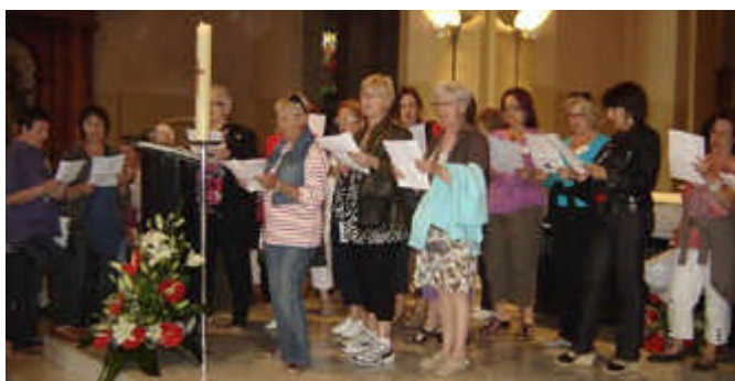
Rosas 2011 : la Chorale