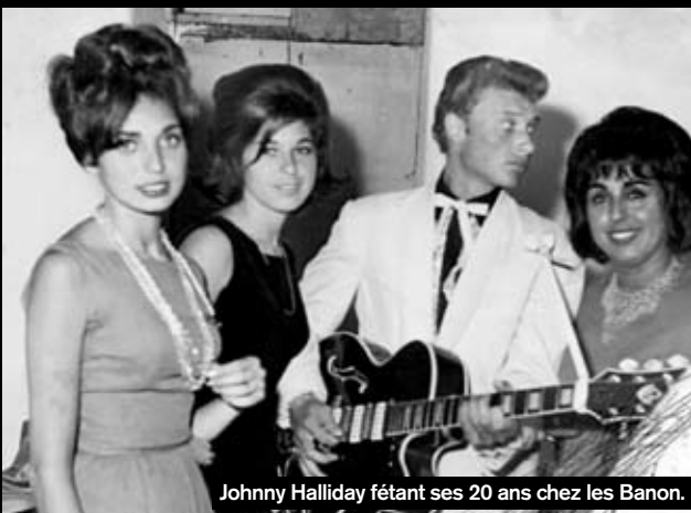
Johnny Hallyday fêtant ses 20 ans chez les Banon.