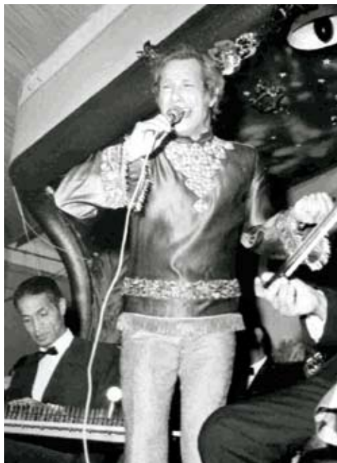
Salim Halali en plein action au Coq d'Or.

APRÈS L'ISMAILIA FOLIES, AVENUE MONTAIGNE, À PARIS, C'EST À CASABLANCA, DANS L'ANCIENNE MÉDINA, QUE SALIM HALALI A OUVERT EN 1949 L'UN DES PLUS PRESTIGIEUX CABARETS DU MONDE, LE COQ D'OR.