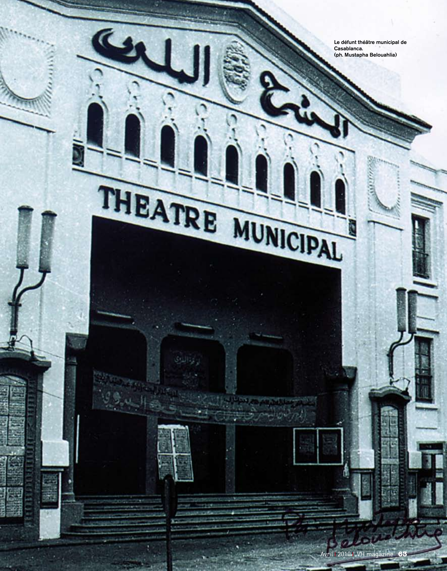
Le défunt théâtre municipal de Casablanca.