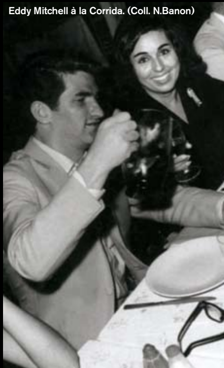
Eddy Mitchell à la Corrida.