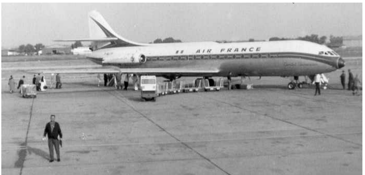
Départ du Maarif pour Lyon, peu avant de monter dans l'avion qui l'a l'éloigner de son pays natal.