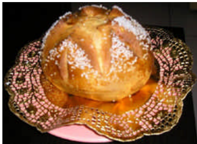
Monas de Danielle Craido

2 heures après les travailler à nouveau et les laisser reposer 2 heures encore. A la fin et avant de cuire. Passer un blanc d'œuf dessus les monnas. Faire une entaille en forme de croix au milieu (aux ciseaux). Et saupoudrer de sucre cassé grossièrement et au four . A vous de voir, pour la Cuisson