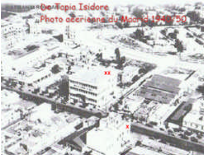
Photo des années 40/50

X : 2 rue des Pyrénées, XX : Manufacture papetière du Maroc