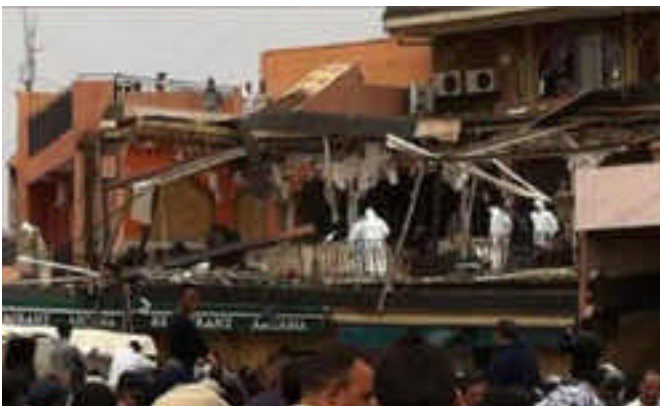
Drame de Marrakech du 28 Avril 2011