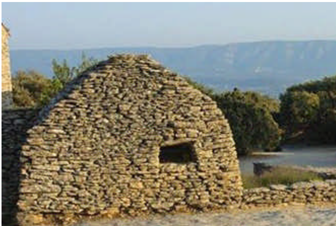
Village des Borie à Gordes Monuments historiques