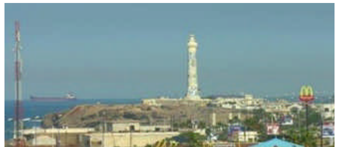
phare d'AIN DIAB