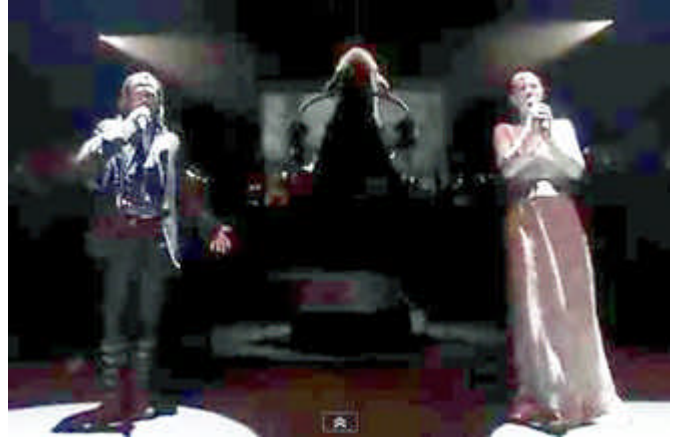
Photo : Patricia Petibon & Florent Pagny - The Day We Made God Cry