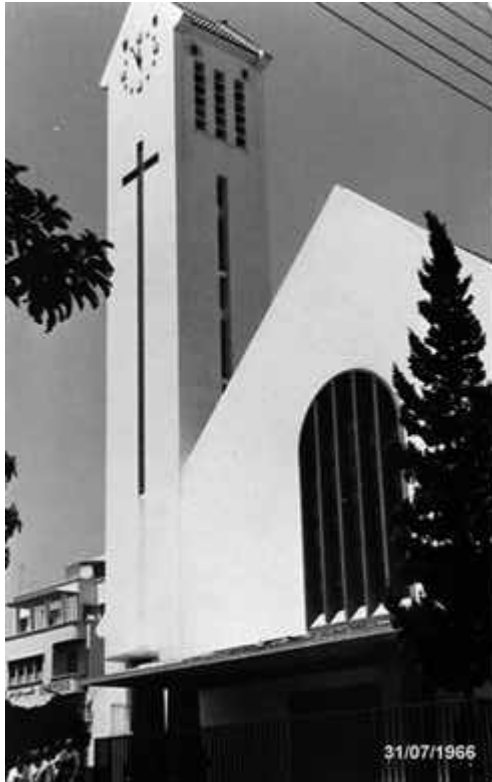
Eglise San Antoine de Padoue