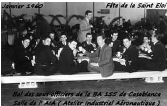
Cludio nous envoie une photo de l'AIA