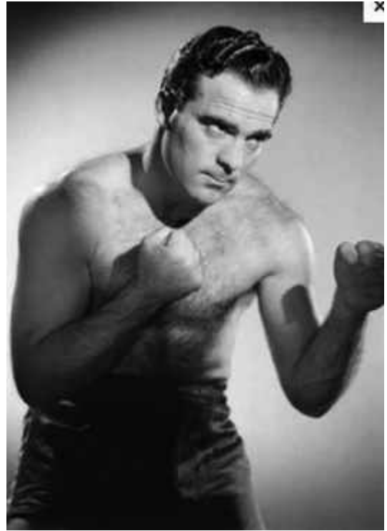
Marcel Cerdan :