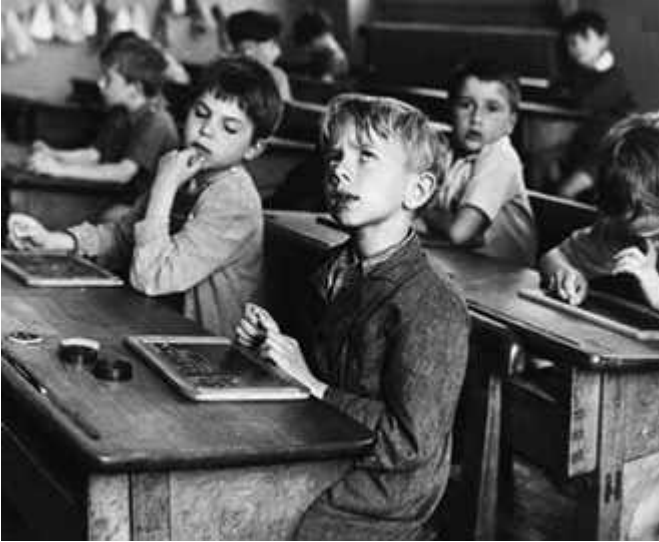
Robert Doisneau "Ecole de la rue Buffon Paris"