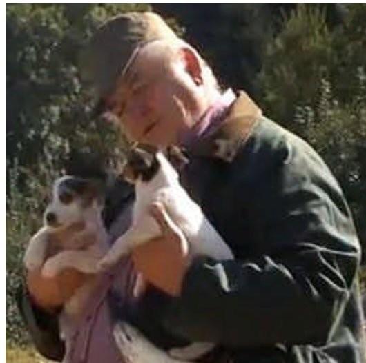
Jeannot le bienheureux

http://www.youtube.com/watch?v=dcsOluEk6fI