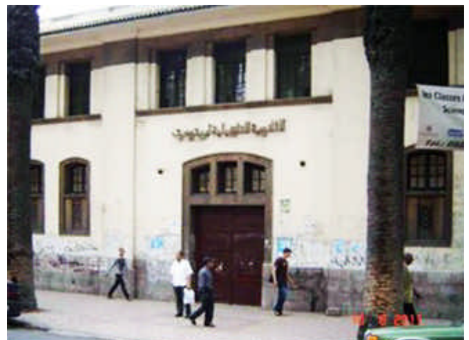
Photo : Collège Ibn Toumert à Casablanca

Salut mon vieux copain. Quelque par sur cette planète, il y a depuis des jours des massacres d'enfants, de jeunes, de vieillards d'hommes et de femmes.